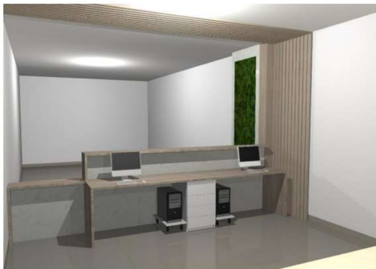
IMAGEM 01: BALCÃO DE ATENDIMENTO