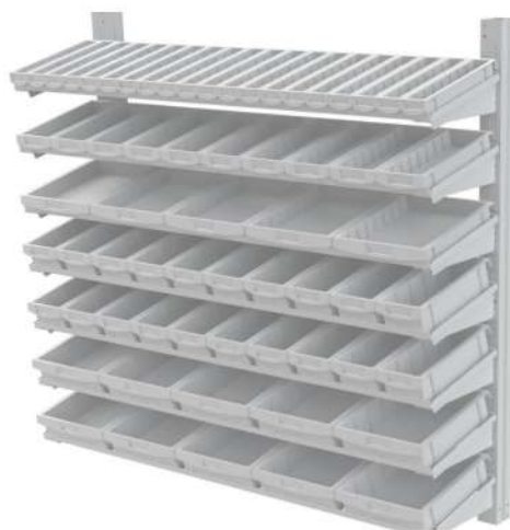
IMAGEM 03: ESTAÇÃO DE TRABALHO COM BINS