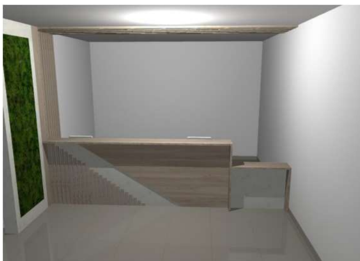
IMAGEM 02: BALCÃO DE ATENDIMENTO FRENTE