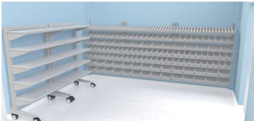
IMAGEM 05: ESTAÇÃO DE TRABALHO VISÃO PANORÂMICA

Demais condições permanecem inalteradas.